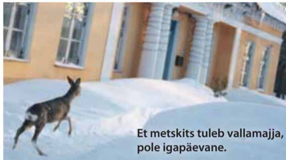
Et metskits tuleb vallamajja, pole igapäevane.

Lisainfo: Jarmo Idavain e-mail: jarmoidavain@hotmail.ee telefon: 5111110